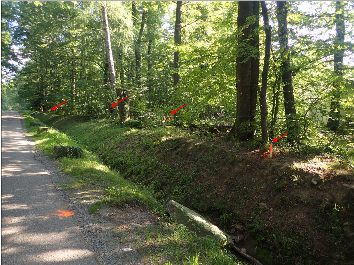
Abbildung 3: Übersichtsbild zur untersuchten Fläche. Die Markierungspflöcke zur Flächenabgrenzung sind durch rote Pfeile markiert.