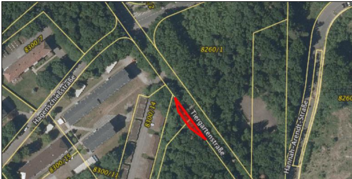
Abbildung 1: Lage und Abgrenzung des Bereichs (rote Abgrenzung) innerhalb dessen vorhandene Gehölze kontrolliert wurden.