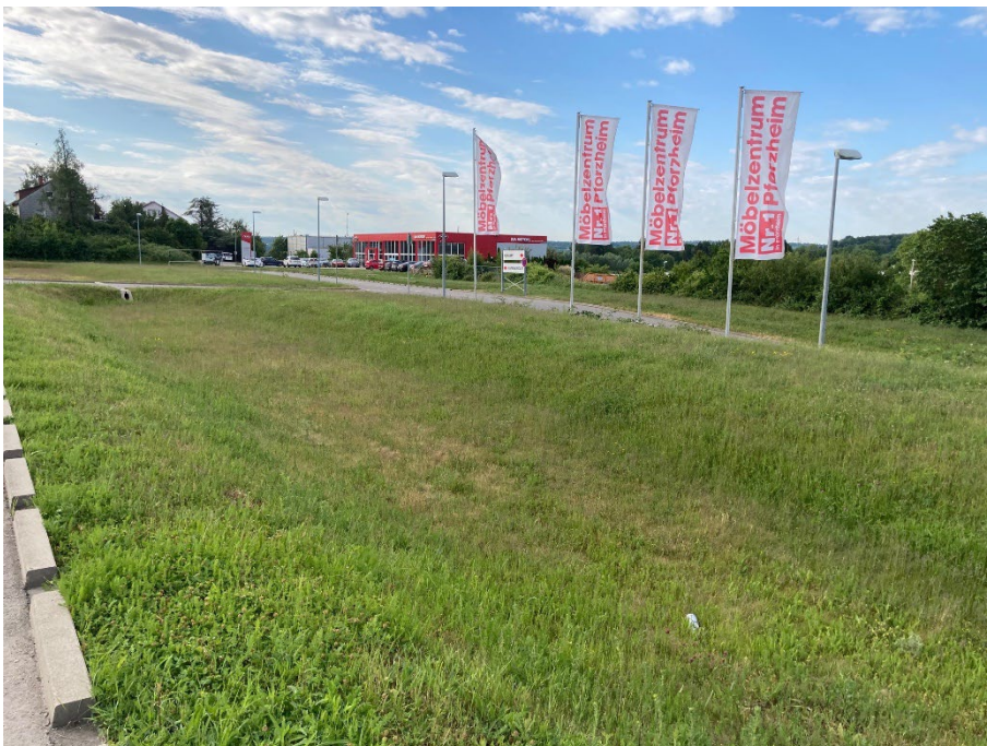
Abb. 2: Entwässerungsmulde des Obsthofstollens