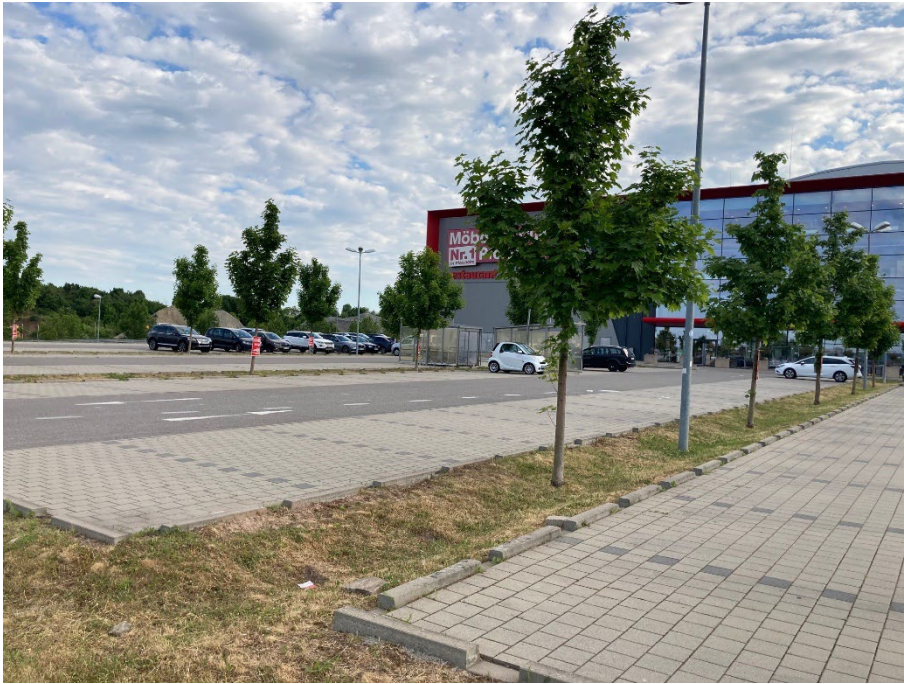
Abb. 1: Parkplatz mit kleinen Grünflächen, Baumbestand und Gebäude des bestehenden Möbelmarktes