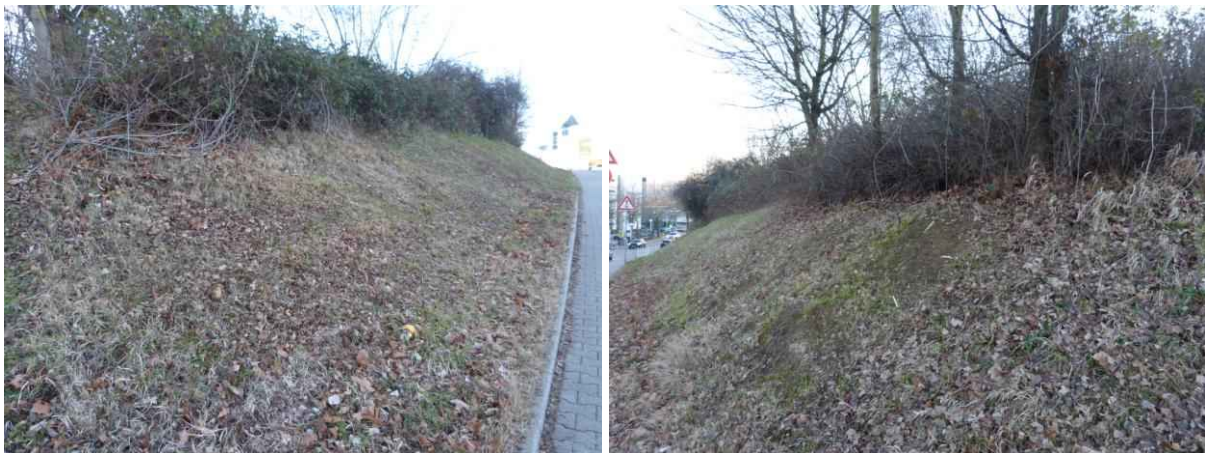
Abb. 3: An den Saumstrukturen der ostexponierten Böschung ist das Vorkommen von Zaun- und Mauereidechsen möglich.

Entlang der Saumstrukturen der Gehölze bzw. des Brombeer-Gestrüpps an den Böschungen ist das Vorkommen von Zaun- und Mauereidechsen denkbar. Daher ist bei einer Umnutzung dieser Bereiche eine Betroffenheit möglich. Hier kann der Verbotstatbestand der Tötung oder Verletzung von Individuen (§ 44 Abs. 1 Nr. 1) in Zusammenhang mit der Zerstörung von Fortpflanzungs- und Ruhestätten (§ 44 Abs. 1 Nr. 3) nicht ausgeschlossen werden. Auch vorhabenbedingte Störungen (§ 44 Abs. 1 Nr. 2 BNatSchG) sind bei einem Vorkommen der Arten sicherlich gegeben.