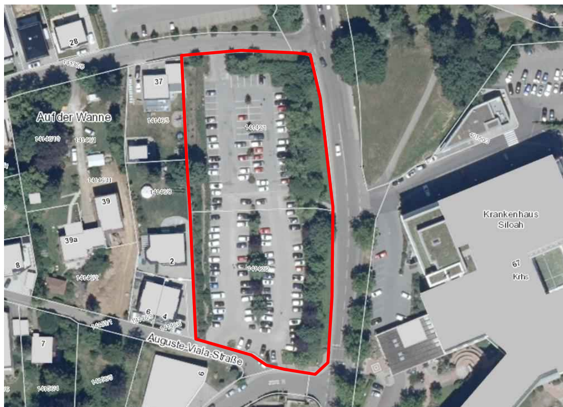
Abb. 1: Lage des Untersuchungsgebietes (UG rot markiert)