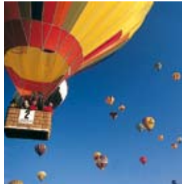
Festival de montgolfières dans un cadre impressionnant