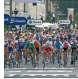
Manifestation sportive internationale : Tour de France