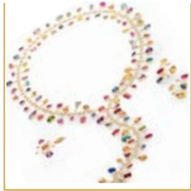
Des chefs-d'œuvre uniques avec des joyaux précieux