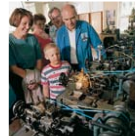
Musée Technique de l'Horlogerie et de la Bijouterie